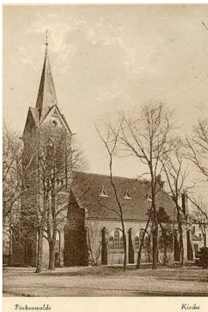
Kościół w Finkenwalde (Zdroje) zdjęcie z archiwum Parafii

( http://www.parafiazdroje.pl/oparafii/historia )